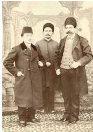
وجیه‌الله میرزا سپهسالار قاجار (سمت راست نفر اول)

دوست علی‌خان معیرالممالک می‌نویسد: «پس از آنکه وجیه‌الله میرزا و همراهان از سفر روس به وطن مألوف بازگشتند، شاهزاده امان‌الله میرزا میرپنج که بعدها در حمله روس‌ها به تبریز خودکشی کرد (و پسرش نام پدر را بر خویش نهاد و سپهبد امان‌الله میرزا جهانبانی شد که در زمان پهلوی دوم سناتور مجلس سنا نیز بود) برایم تعریف نمود که وقار و منانت وجیه‌الله میرزا، درباریان تزار را به تحسین واداشته بود.» سرانجام وجیه‌الله میرزا سپهسالار، در سال ۱۳۲۲ ه.ق (حدود ۱۲۸۳ ه.ش) در ۵۱ سالگی دار فانی را وداع گفت. پیکر او را در جوار حرم حضرت عبدالعظیم حسنی ؟؟ در باغ طوطی به خاک سپردند. در گذشته قبر او در اتاق مخصوصی بود. به نوشته دوست علی‌خان معیرالممالک، در مقبره‌اش پرده‌ای نقاشی بر دیوار او را در لباس نظام به‌اندازه جسم طبیعی نشان می‌دهد و نموداری است از آنچه که وجیه‌الله میرزا سیف‌الملک، امیرخان سردار و سپهسالار بوده است. اما امروز از مزار او يك قطعه سنگ مرمر و سفید با قطع کوچک حدود ۵۰ در ۷۰ باقی است که بر روی آن با خط نستعلیق نوشته شده است: «آرامگاه شادروان وجیه‌الله میرزا سپهسالار که در سال ۱۳۲۲ وفات نموده است». وجیه‌الله میرزا ثروت زیادی از خود برجای گذاشت. بیمارستان هاجر کنونی (۵۰۱ سابق ارتش) واقع در جنوب یوسف‌آباد توسط او احداث و وقف شده است (مرآت‌الوقایع مظفری، ج ۲: ۷۳۱-۷۳۲). از القاب او سپهسالار، سیف‌الملک، سردار معظم و امیرخان سردار بوده است (سلیمانی، ۱۳۷۹: ۴۰)