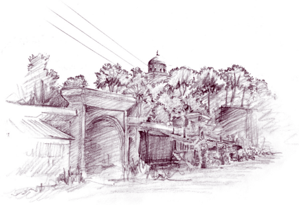
تصویر ۱: مجموعه هتل و عملکردهای پیرامون امامزاده

موقعیت ویژه امامزاده هاشم علیه السلام به عنوان اولین توقفگاه، بعد از ورود به خطه شمال تصویری ویژه برای ابران پدید آورده است مکانی مناسب برای جاینمایی ورودی پهنه شمالی از سمت آزادراه قزوین - رشت می باشد. "امامزاده هاشم رشت درست در جایی است که باید میل راهنما باشد. بر فراز تپه ای در کنار پیچ جاده و در جاییکه مسیر راه عوض می شود." ۹ (تصویر ۲)