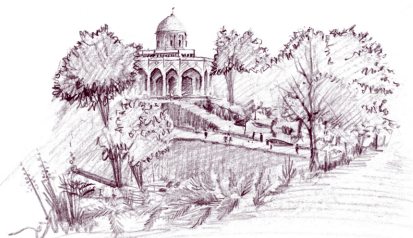
تصویر ۲: دورنمای کلی مجموعه امامزاده هاشم

انسان ساخت و یا فضاهای زراعی سبز قابل رویت می‌باشند. ۱۰