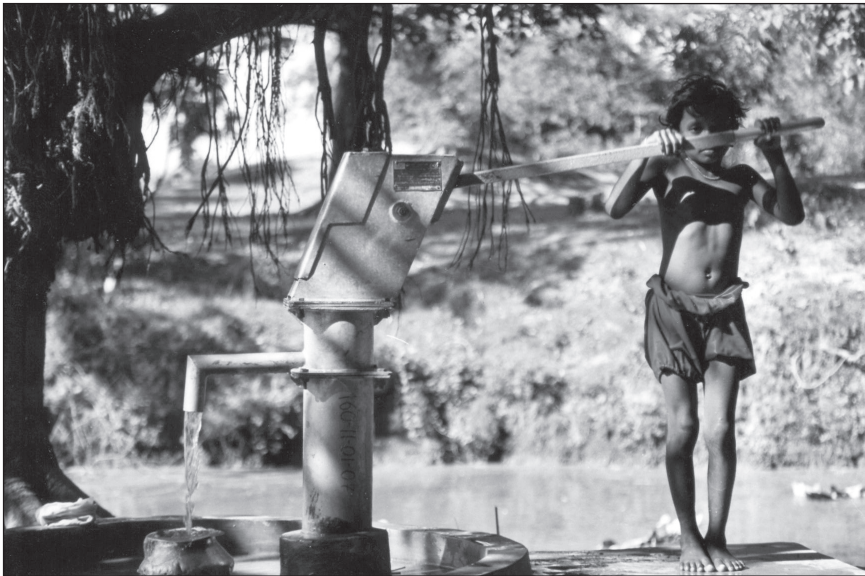
وقف، ابزاری اسلامی برای کاهش فقر در بنگلادش

اقتصاددان برجسته اسلامی منذر کھف به سه نوع وقف اشاره کرده است: ۱- وقف دینی: مساجد و املاک و مستغلاتی که از نظر درآمدزایی برای تأمین هزینه‌های نگهداری و امورات مساجد محدودیت دارند در زمره وقف دینی قرار