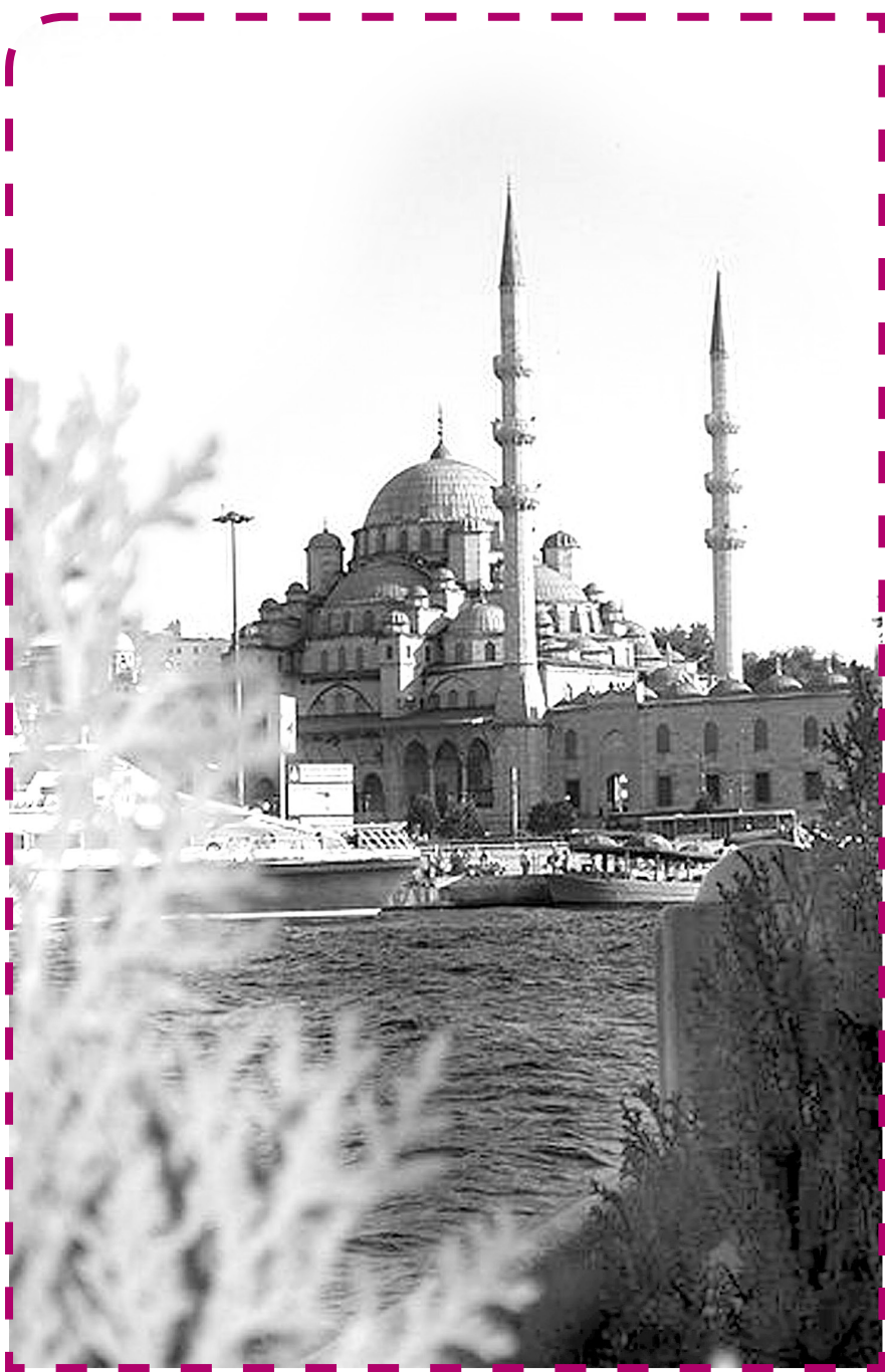
مسجد جامع از آثار خدیجه طرخان والده سلطان