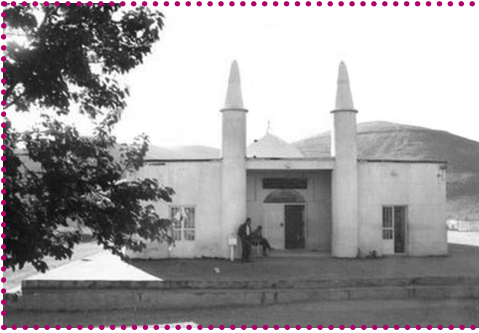
ساختمان قدیمی امام زاده