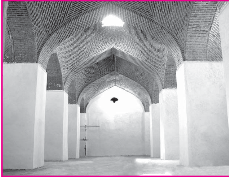
تصویر شماره ۴: فضای داخلی آب انبار شیخ علیخان زنگنه اسدآباد

شده است و با ملات آهکی بندها را پر کرده‌اند. اندود مخزن نیز تا ارتفاع ۲٫۷ متر ساروج است. آب مورد نیاز مخزن از محل یک رشته انشعاب قنات و آب جاری که به نام (آب ده شهرآب) معروف بوده تأمین می‌شده است (۱۱).