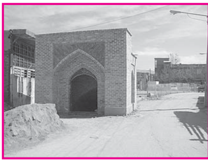
تصویر شماره ۱: مدخل ورودی آب انبار شیخ علیخان اسدآباد

بخش اصیل بنا شامل مخزن بزرگی به ابعاد ۲۰ در ۱۲ متر است (تصویر ۴). در رابطه با فضای مخزن آب انبار شاید بتوان گفت که به لحاظ بزرگی فضا و گنجایش در بین آب انبارهای تاریخی ایران شاخص می باشد، چراکه مخزن اکثر آب انبارها فضایی استوانه‌ای شکل است که گنبدی بر روی پلان دایره دیواره‌ها این فضا را مسقف می کرده اما در مورد آب انبار شیخ علی خان این فضا، مستطیل شکل ساخته شده و متشکل از ۵ طاق چشمه در هر کدام از طرفین مخزن که هر کدام مساحتی معادل با ۱۰ مترمربع دارند و ۵ طاق کژاوه‌ای شکل در وسط که جمعاً مخزن بزرگی را به وجود آورده به گنجایشی که ۵۰۰ متر مکعب آب را در خود جای می دهد (تصویر ۵). مصالح مورد استفاده از لاشه سنگ و آجر است که تا ارتفاع زیر طاق در فضای پاشیر و تا ارتفاع ۱،۵ متر در فضای مخزن، سنگ چین می باشد و در باقی جداره‌ها از آجر با ابعاد ۱۸ در ۱۸ در ۵ سانتی متر استفاده