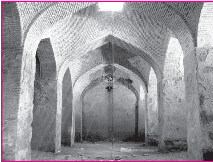
تصویر شماره ۶: فضای داخلی آب انبار شیخ علیخان زنگنه پیش از مرمت

بنای مذکور در سالهای ۱۳۸۶، ۱۳۸۷، ۱۳۸۸ و ۱۳۸۹ از سوی سازمان میراث فرهنگی شهرستان اسدآباد مورد تعمیر و مرمت قرار گرفته است، تعمیرات صورت گرفته شامل؛ عملیات مرمتی بدنه‌ها و کف‌سازی فضای آب انبار، احداث کانال دفع رطوبت در تمامی سطوح آب انبار به ابعاد ۶۰ \times ۷۰ سانتی متر با آجر و ملات ماسه و سیمان - پوشش سقف کانال‌ها با آجر و ملات خاک و گچ - کشیدن اندود سیمان به ضخامت ۳ سانتی متر روی طاق‌ها - کف‌سازی با آجر و ملات ماسه و سیمان مطابق با طرح اولیه - برداشتن دیوارهای الحاقی داخل آب انبار. آوار برداری و مرمت طاق پشتبام - شیب‌بندی پشت‌بام و آماده سازی جهت کشیدن اندود سیمان - کشیدن اندود سیمان و ماسه با عیار ۲۵۰ کیلوگرم در مترمربع به ضخامت ۳ سانتی متر - اجرای عایق‌کاری به صورت دولایه قیر و یک لایه گونی و آسفالت - تهیه و نصب ۴۵ متر لوله پلیکا در عرض آب انبار جهت عبور آب‌های سطحی بوده است (۱۲) . (تصویر ۶)