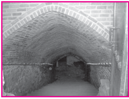
تصویر شماره ۲: پلکان ورودی آب انبار شیخ علیخان زنگنه اسدآباد