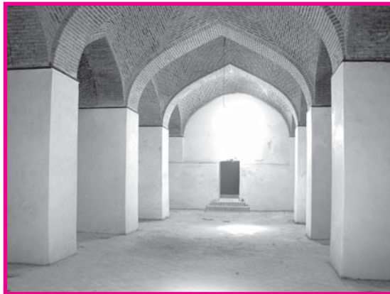
شکل شماره ۵: فضای ورودی و طاق‌های آب انبار شیخ علیخان زنگنه اسدآباد