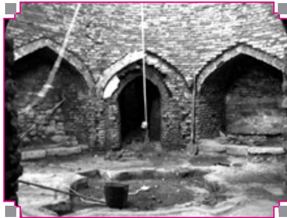
تصویر شماره ۷: فضای سربینه (حوض خانه) حمام نیلوفر اسدآباد قبل از مرمت

دارد، به ابعاد ۳۷۰ \times ۳۴۰ سانتی متر و بخش سمت چپ به ابعاد ۳۴۰ \times ۳۱۰ سانتی متر است. بر روی هر یک از این سه بخش یک طاق گنبدی زده شده است. در ضلع غربی بخش مرکزی، خزینه آب گرم قرار دارد که امروز از آن جهت مخزن آب گرم حمام استفاده می‌شود، محل ورود به خزینه آب گرم به وسیله پنجره فلزی مسدود گردیده است. در دهه قبل خزینه آب سرد به شش دوش انفرادی تبدیل شده است. در ضلع غربی بخش سمت چپ، محلی به نام خلوتی وجود داشته که در دهه قبل به سه دوش انفرادی دیگر مبدل شده است، رو به روی مدخل ورودی به گرم‌خانه محل تنویر خانه حمام بوده است (۱۰). (۱۱)