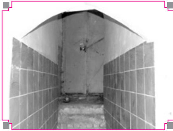
تصویر شماره ۳: مدخل ورودی جنوبی حمام نیلوفر اسدآباد از جانب کوچه مجاور