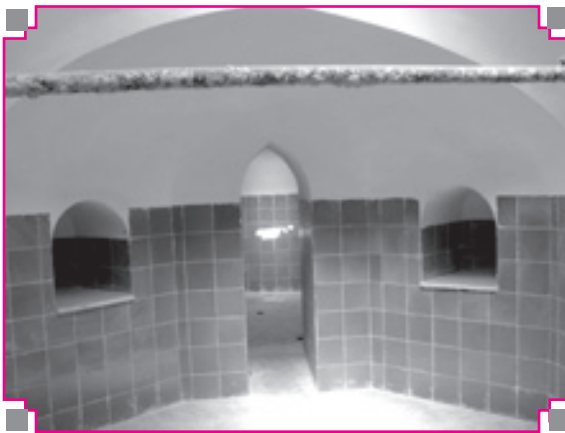
تصویر شماره ۶: بخش دوم حمام نیلوفر اسدآباد بعد از مرمت سال اخیر

سکویی است به دهانه ۸۰ و عمق ۸۰ و بلندا تا پای طاق، ۱۲۵ سانتی متر است. طاق این صفه هلالی است. گرم‌خانه از سه قسمت مجزا از یکدیگر ساخته شده؛ بخش مرکزی به ابعاد ۳۴۰ × ۳۴۰ سانتی متر و بخش سمت راست که خزینه آب سرد در ضلع غربی آن قرار