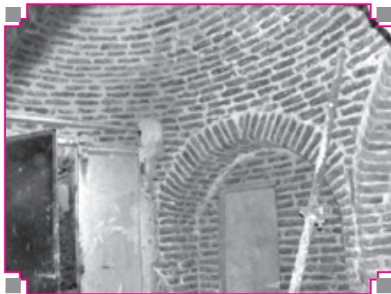
تصویر شماره ۲: هشتی ورودی واقع در ضلع شمالی حمام نیلوفر اسدآباد

ورودی جنوبی؛ بر اساس مطالعات انجام شده ورودی جنوبی بنا نیز بعداً به بنا الحاق شده و در گذشته تنها ورودی بنا از جبهه شمالی بوده است. در این ورودی نیز آهنی بوده و فاقد تزیینات و جزییات معماری می‌باشد (۸) (تصویر ۳).