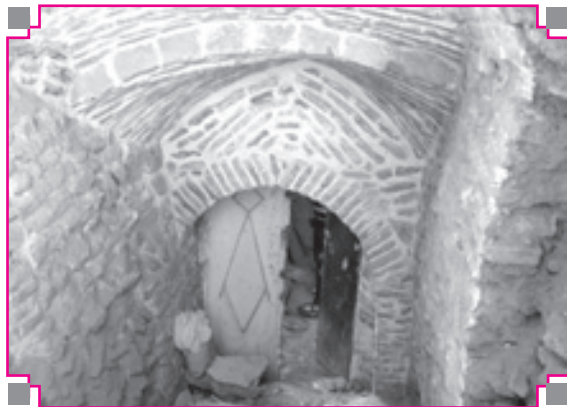
تصویر شماره ۱: مدخل ورودی شمالی حمام نیلوفر اسدآباد

سریینه؛ سریینه هم محوطه‌ای هشت ضلعی است که در شش ضلع آن، شش صفه برای رخت کردن ساخته شده است (تصویر ۴)، سقف همه این صفه‌ها جناغی است. امروزه تزیینات احتمالی، کف و کفش‌کن‌های بنا در زیر لایه‌های کف‌سازی و سیمان و کاشی مدفون شده است. برای رسیدن به گرم‌خانه بنا مانند دیگر حمام‌های تاریخی باید از یک راهروی باریک عبور کرد. این راهرو یا همان فضای میان در با یک گردش ۴۵ درجه به چپ و یک گردش ۹۰ درجه به راست فضای سرد حمام را به فضای گرم و مرطوب متصل کرده است. در فضای میان در