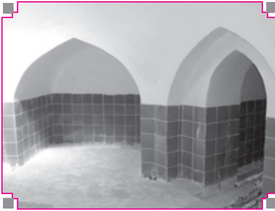
تصویر شماره ۵: حجره‌های داخلی حوض خانه حمام نیلوفر اسدآباد بعد از مرمت سال اخیر