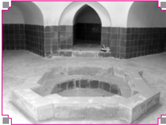
تصویر شماره ۴: سربینه (حوض خانه) حمام نیلوفر اسدآباد بعد از مرمت سال اخیر

صفه دوم: به دهانه ۲۰۰ و عمق ۹۵ و بلندا تا ابتدای طاق، ۱۰۰ سانتی متر است با طاق جناغی است.