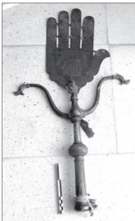
نمای کلی از پنجه فلزی روستای کله سر

بعدها در دوره قاجار ادامه پیدا کرد. هنر قلمزنی بر روی فلزات و نیز خوشنویسی در این مرحله با هنر فلزکاری آمیخته شده و آمیزه‌ای از هنرهای تزئینی و کاربردی، آثار جاودانه‌ای را در زمینه فلزکاری برجای گذاشت. علم‌های ساخته شده در دوره صفوی، تیغه‌های بلند و باریک داشتند که دور این قاب را با سرهای اژدها که از هنرهای چینی و ژاپنی اقتباس شده بود می‌آراستند که به عنوان حافظان و نگهبانان این علم‌ها بودند. این علم‌ها را بر روی دسته‌ای چوبی یا فلزی قرار می‌دادند و پیشاپیش دسته‌ها حمل می‌شد. در سال‌های بعد به خصوص در دوران زندیان و قاجار تزئینات دیگری به علم‌ها اضافه شد و عزاداران مذهبی در ایام سوگواری یا بزرگداشت و تشریفات آن را به کار می‌بردند. ۵