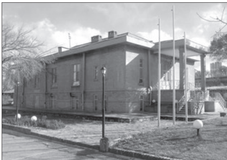
عمارت و کتابخانه موقوفی بهاءالملک (مرکز اسناد میراث فرهنگی همدان)