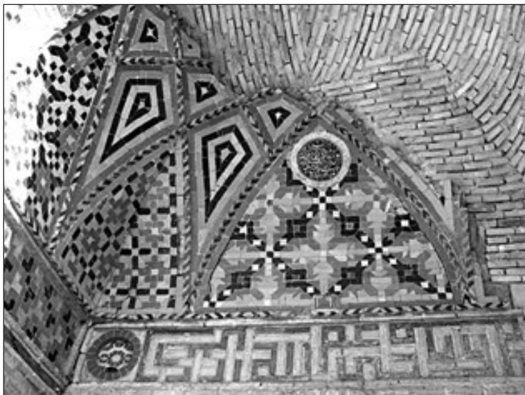
محل نصب کتیبه کاشی که نام ملک التجار در آن دیده می شود