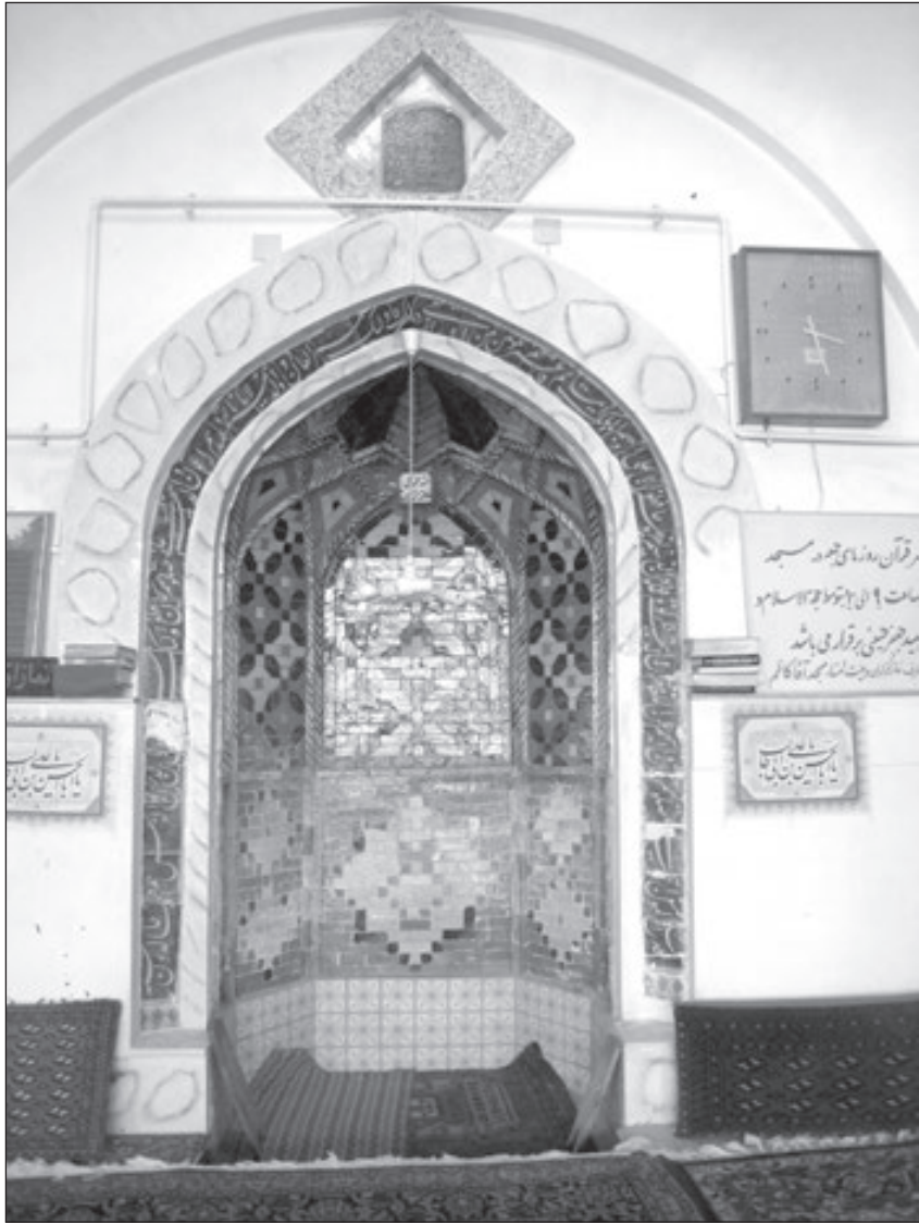
کتیبه وقف در بالای محراب مسجد آقا کاظم