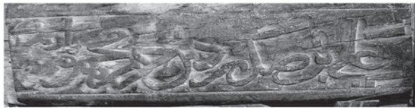
تصویر ۷: کتیبه‌های حاوی نام بانی منبر (نگارنده)