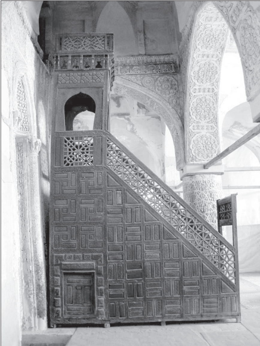
تصویر ۴: نمای کلی منبر مسجد جامع نایین

در مجموع تعداد شش کتیبه در بخش‌های مختلف منبر مسجد جامع نایین