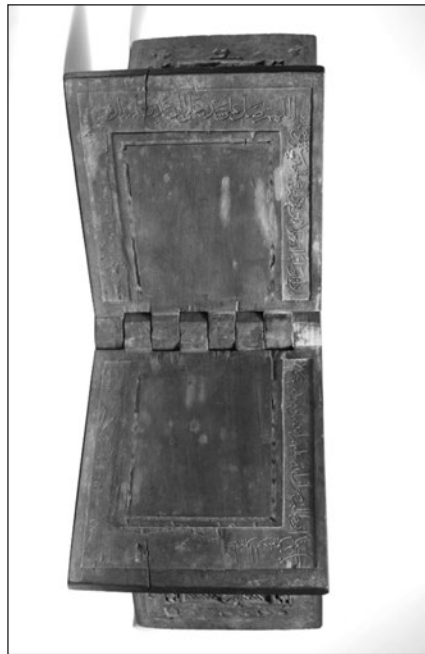
تصویر ۱۱ : کتیبه‌های داخل رحل موزه متروپولیتن