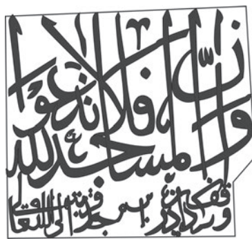
تصویر ۳: کتیبه‌های روی لنگه چپ در