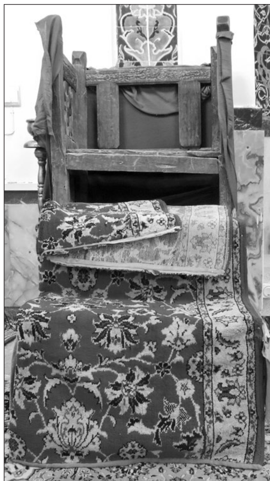
تصویر ۶: نمای کلی منبر مسجد جامع روستای یارند (نگارنده)

نوسازی شد. با ارزش ترین اثر تاریخی یارند، منبر چوبی مسجد جامع آن است. این منبر سه پله، دارای ارتفاع ۱/۳۰ و عرض ۵۳ سانتی متر است (۱۰) . اتصالات منبر به شیوه فاق و زبانه و در قسمت تکیه گاه مسند با استفاده از میخ های آهنی صورت گرفته است. بدنه منبر فاقد تزیینات است و تنها دیواره های دو طرف مسندگاه، دارای مشبک کاری های ساده ای است (تصویر ۶).