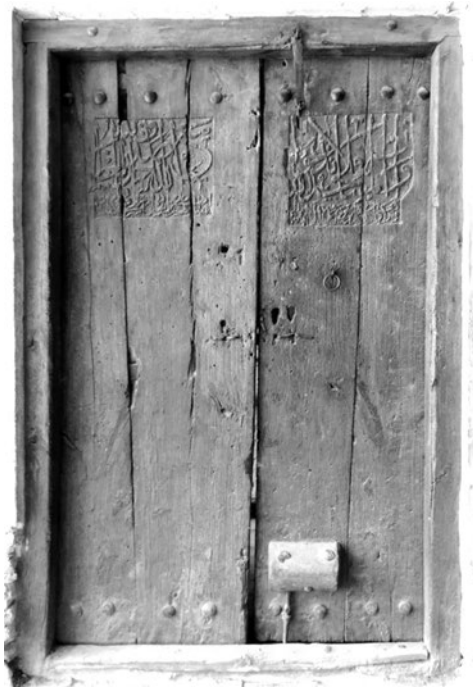
تصویر ۱: نمای کلی در راهروی وضوخانه مسجد جامع اصفهان (نگارنده)

درهای قدیمی و اصلی (بازسازی نشده) شهر اصفهان است، که از چوب چنار ساخته شده است. جسم اصلی هر لنگه، از دو تخته تشکیل شده که با اتصالات چوبی به هم متصل شده‌اند. بر روی در، هیچ‌گونه نقش تزئینی وجود ندارد و تنها در دو کادر بالای هر لنگه، یک کتیبه به قلم ثلث زیبایی حک شده است که سبب شده آن را از حالت سادگی خارج کند (تصویر ۱).