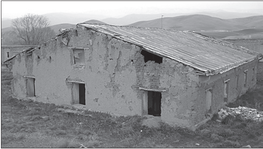
پرورشگاه دارالایتام مستر استد آمریکایی در روستای استدآباد