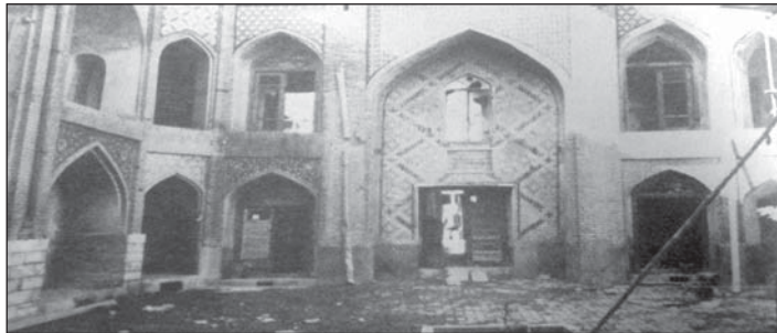
تصویر ۳: مدرسه پریزاد برگرفته شده از کتاب اوکین

اتاق‌های گنبددار است. این بنا با کاشی‌کاری، مقرنس‌کاری، آینه‌کاری و کتیبه تزئین یافته است. ۳۹