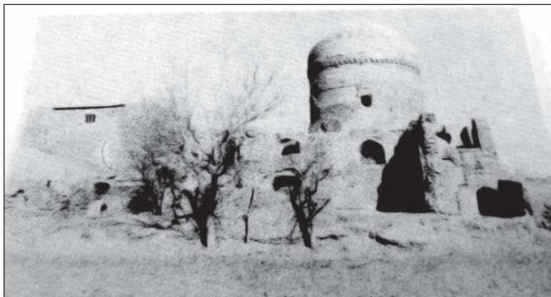
تصویر ۲: مدرسه تومان آغا بر گرفته شده از کتاب اوکین

مدرسه تومان آغا در ده کیلومتری شرق مزار ایران کوشان سر راه هرات مشهد واقع است. این شهر کوهستان هم نامیده می شود و در شمال هری رود واقع شده است. ۲۹ خواندمیر در مورد موقوفات او می نویسد: «تومان آغا در قصبه کوسویه مدسه ای نیکو بنا کرده و در چهار فرسخی آن قبه رباطی وسیع و رفیع از حیز قوت به فعل آورده» ۳۰ پلان این بنا آمیزه ای از هشت ضلعی و شکل مربع است که مشتمل بر یک ایوان طاق دار، دو گورخانه، یک مسجد و تعدادی حجره است. ۳۱ و خود تومان آغا در مسجد مدرسه به خاک سپرده شده است. ۳۲ در دیوارهای بنا طاق نماهای عمیقی وجود دارد که بعضی از آنها در دیوارهای اطاق پیش رفته و روزنه های کوچکی بالای آنها تعبیه شده است. طاق نماهای مستطیل شکل بر روی محورهای متقاطع مجموعه ای از قوس های متوالی و طاق نماهای هشت ضلعی بر روی محورهای دیگر کاربندی های گچی را که سه نوع طرح کوبی ایجاد کرده اند، ارائه می دهند. گنبد دو پوسته این بنا نیز بر روی گریو مرتفع استوانه ای شکل قرار دارد و در زیر آن یک هشت ضلعی است که هر ضلع آن ۵/۷۵ متر طول دارد. درون گنبد نیز هشت دیوار خشخاشی قرار دارد که بر روی شانه های گنبد داخلی بنا گذاشته شده است. ۳۳