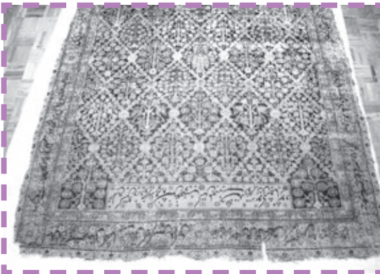
تصویر ۲: نمایی از وقف‌بافته موجود در قالی