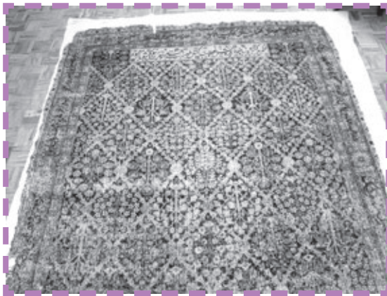
تصویر ۱: قالی وقفی موجود در موزه ملی

اطلاعات اولیه این مقاله حاصل مطالعه و یادداشت برداری از منابع کتابخانه‌ای بوده و در گام بعد ثبت مشاهدات موزه‌ای و در نهایت جمع و تحلیل تمامی داده‌ها منتج به شکل‌گیری این مقاله شده و روش پژوهش توصیفی، تاریخی و تحلیلی است.