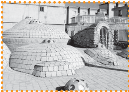
تصویر ۱: حمام گله‌داری بندرعباس

از پنج گنبد کوچک و بزرگ است که سطح زیرین آنها دارای کاربندی‌های زیبایی است. در میانه گنبد‌های بزرگ روزنه‌های نورگیری تعبیه کرده‌اند. سیستم گرمادهی حمام مشتمل بر انبار سوخت، دیگ، آتشدان، دودکش‌ها و گودالی برای جمع‌آوری خاکستر است. تون حمام در عمق زمین تعبیه شده است. مصالح مورد استفاده در بنا سنگ اسفنجی و ملات ساروج محلی است. این بنا به ثبت تاریخی رسیده است. ۲۹