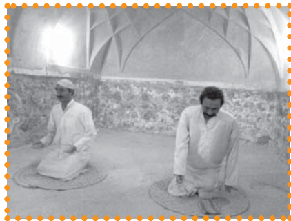
تصویر ۳: حمام گله داری بندرعباس

این بنا در گوشه شمال غربی تکیه پهنه بین مسجد جامع و مسجد امام و امامزاده یحیی علیه السلام واقع گردیده و از موقوفات مسجد جامع است. حمام پهنه از قدیمی ترین حمام های موجود و از آثار ارزشمند سمنان به شمار می رود. بر اساس نوشته کتاب مطلع الشمس، تا دوره ناصرالدین شاه کتیبه ای با این مضمون بر سردر بنا نصب بود « امر ببناء هذا الحمام المبارك فی زمان دولت السلطان الاعظم ملک الملوک فی العالم مغیث الحق و الدنيا والدین