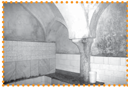
تصویر ۸: حمام خسرو آقا

خواجهگان حرم شاه سلیمان صفوی بوده است و موقوفات زیادی از او و برادرش علیقلی آقا به جا مانده است. حمام خسرو آقا همچون اکثر حمام‌های قدیمی از دو بخش سربینه و گرماخانه تشکیل می‌شده است. ۳۴ متأسفانه با وجود این که این حمام در سال ۱۳۵۳ در فهرست آثار ملی ثبت شده بود، در سال ۱۳۷۴ هـ.ش به دلیل قرار گرفتن در امتداد خیابان استانداری تخریب شده است. ۳۵