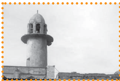
تصویر ۵: مناره مسجد گله داری بندر عباس که حمام گله داری وقف این مسجد شده است.