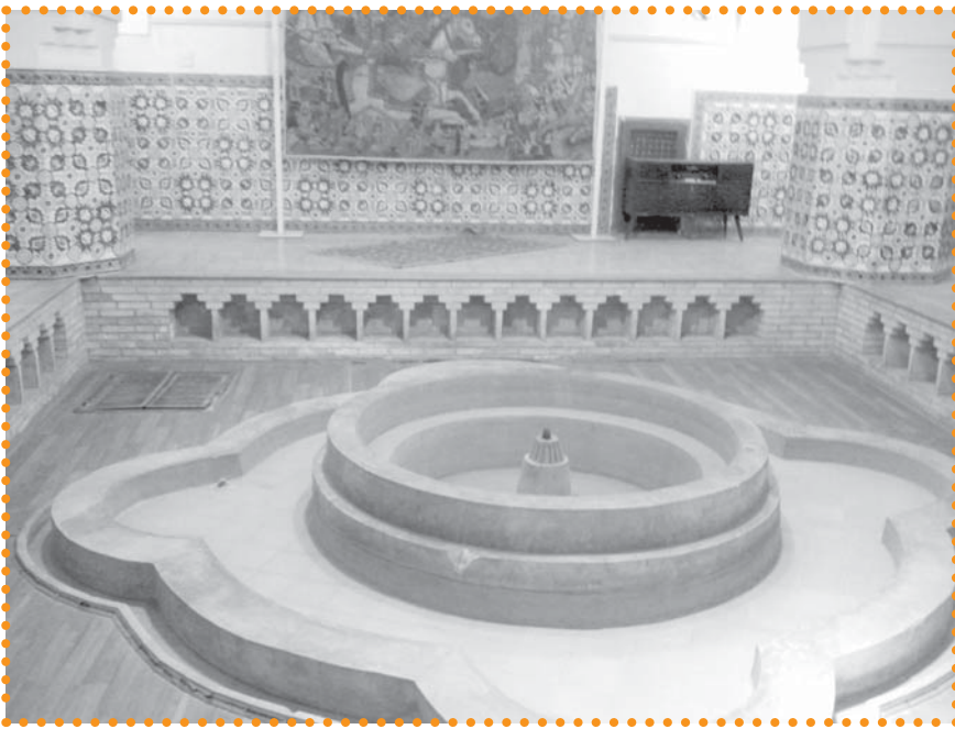
تصویر ۶: حمام پهنه سمنان

این بنا در میدان روستای افوشته - از توابع نظنز - در حدود ۱۰۰ متری