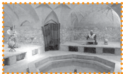
تصویر ۲: حمام گله‌داری بندر عباس