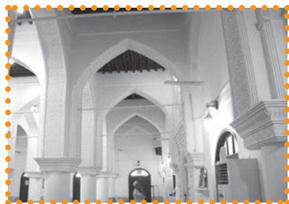
تصویر ۴: مسجد گله داری بندر عباس که حمام گله داری وقف این مسجد شده است.